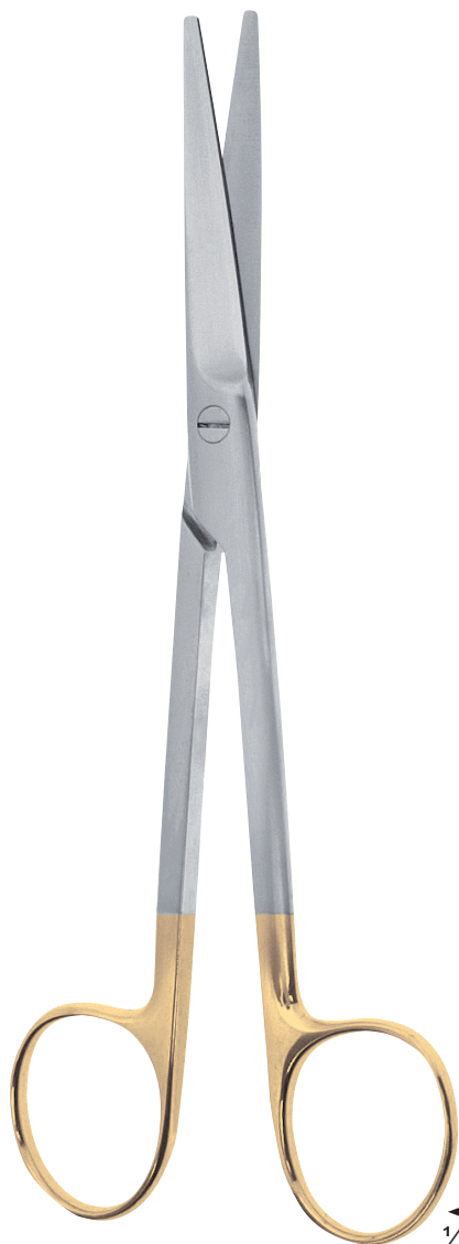
MAYO 05-1550 - 05-1551

Uncino per vasectomia per l'estrazione del canale deferente utilizzando la tecnica d'incisione dello scroto.